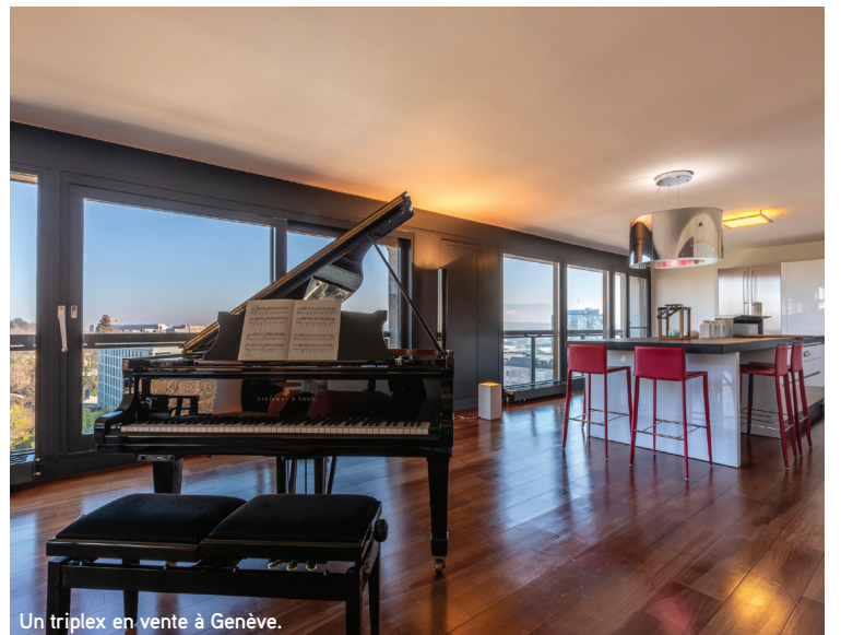
Un triplex en vente à Genève.