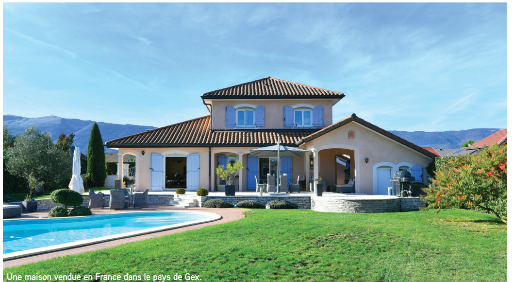
Une maison vendue en France dans le pays de Gex.