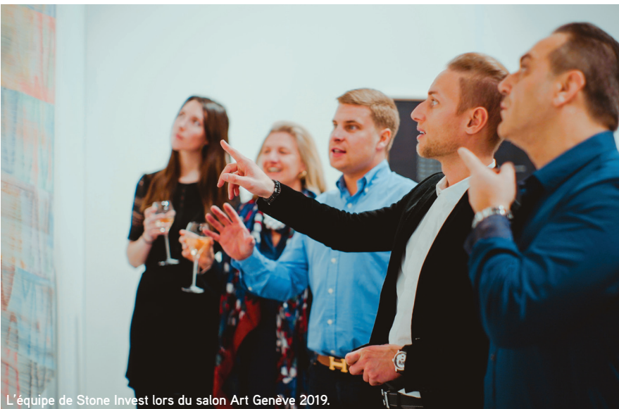
L'équipe de Stone Invest lors du salon Art Genève 2019.